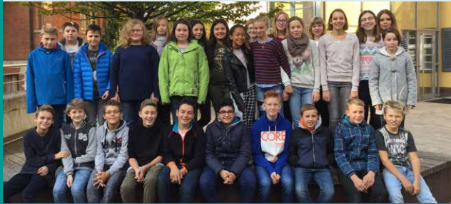
DIE AUTORINNEN UND AUTOREN DER KLASSE 7B DER PRIVATEN REALSCHULE PINDL